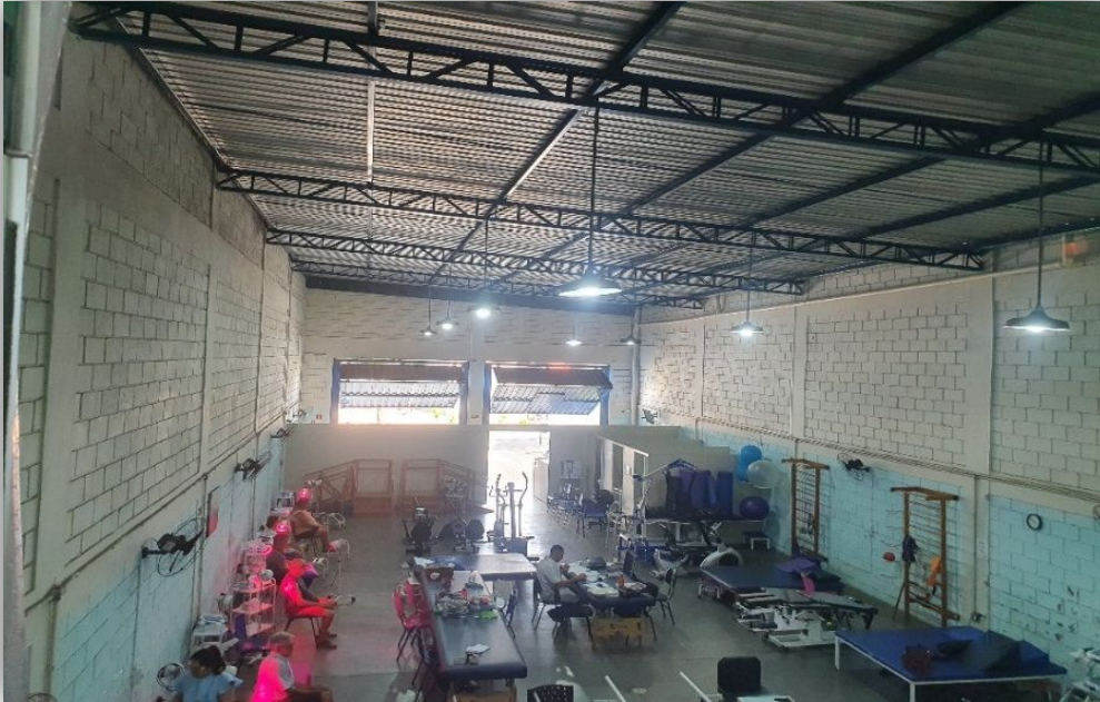
Pintura da sede da APD